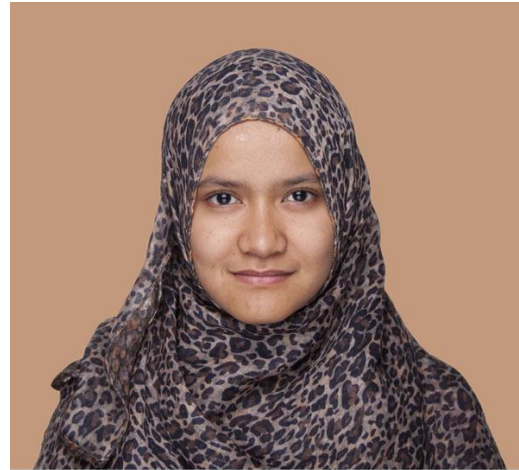
PANTONE 67-5 C

Vergleiche dazu auch die Veranstaltung „Angélica Dass: Welcher Pantone-Typ sind Sie?“ am Eröffnungswochenende Samstag, 30. November 2013, ab 16.00 Uhr und Sonntag, 1. Dezember 2013, 10.00-17.00 Uhr