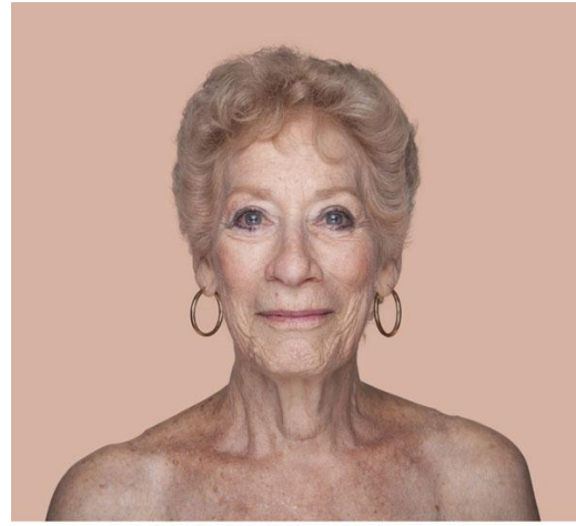
PANTONE 94-6 C

Gewerbemuseum Winterthur Kirchplatz 14 CH-8400 Winterthur Telefon +41 (52) 267 51 36 gewerbemuseum@win.ch www.gewerbemuseum.ch