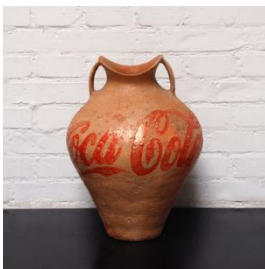
Ai Weiwei, «Han Dynasty Urn with Coca Cola Logo», 1994 ©Private Collection