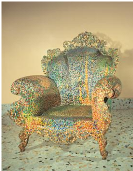
Alessandro Mendini, Proust Chair, 1978