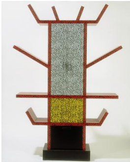
Ettore Sottsass (for Memphis), sideboard «Casablanca», 1981