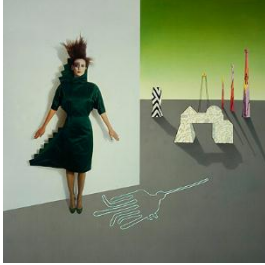
Cinzia Ruggeri, «Hommage to Lévi-Strauss dress», Autumn/Winter 1983 – 84 Foto : Occhiomagico 1984