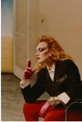
Lady Shiva in Thema Selection