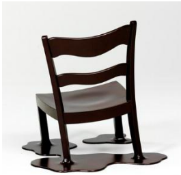
Robert Haussmann, Choco-Chair, 1967