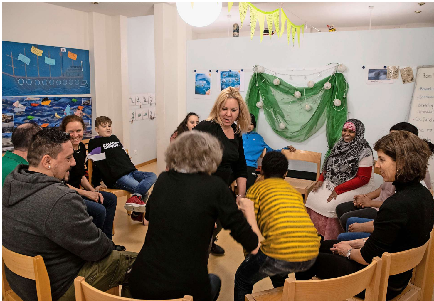
Eltern sollen zusammen mit Kindern in der Familienklasse Spass haben können – bei einem Spiel im Kreis.

Schon als Schulleiterinnen der Schule Hardau war den beiden die Elternarbeit ein Anliegen. Schilling sagt: «Eltern wollen prinzipiell nur das Beste für ihre