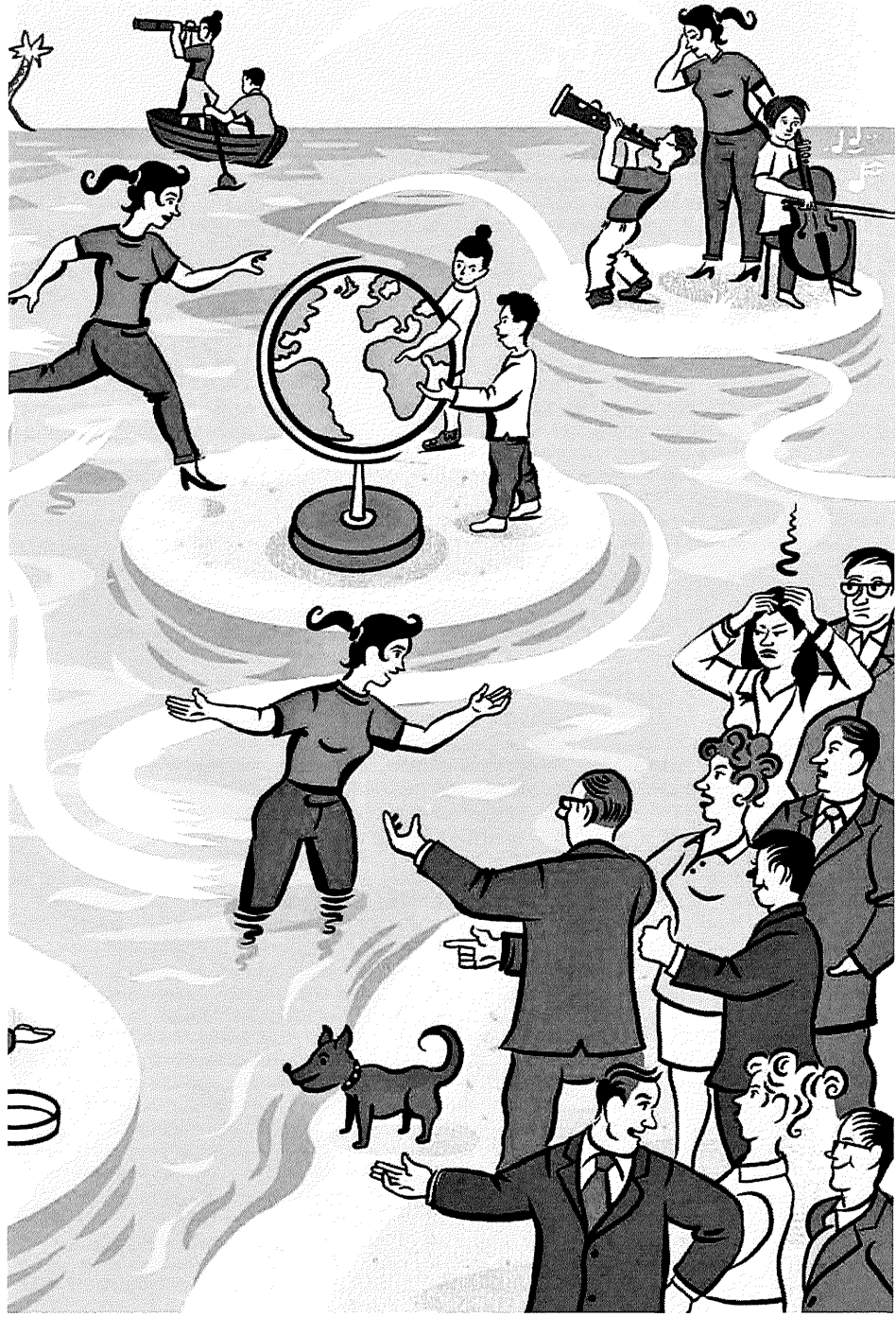
ILLUSTRATION: ANDREA GABREZ